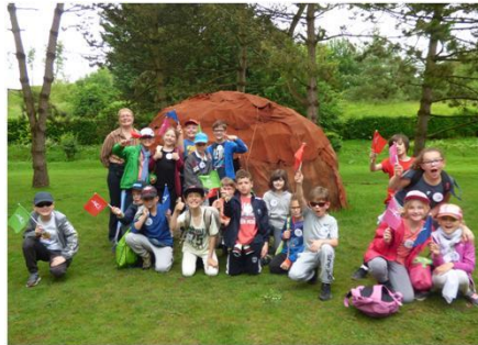
Atelier Jeu Sport Santé Nature avec le CDOS

En dépit des énormes difficultés financières de l'USEP, ce rendez-vous annuel voyait la présence d'une bonne douzaine de classes venues le plus souvent d'Amiens mais aussi d'Ailly le Haut Clocher, Roiglise et Bouchoir. Soit plus de trois cents jeunes qui ont pris beaucoup de plaisir à se familiariser sur les différents sites de Samara à des disciplines pas toujours inscrites du reste au programme olympique.