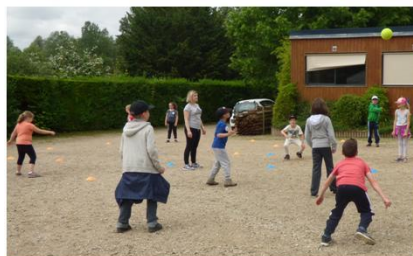
Atelier Ballon au Poing avec la Fédération BP