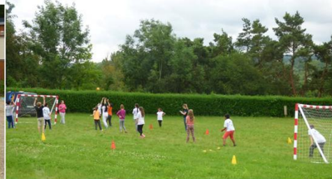
Atelier Handball avec le Comité Départemental