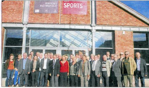
Trente-huit présidents et responsables de la région Nord-Est réunis à Amiens

Pas question de s'en laisser conter. Les représentants des CROS (Comité Régional Olympique et Sportif) et CDOS (Comité Départemental Olympique et Sportif) réunis ce week-end en Inter Région Nord Est ont rédigé une motion destinée à leur ministre de tutelle. Les participants au rendez-vous amiénois s'émeuvent des intentions prêtées au ministre de la ville, de la jeunesse et des sports, Patrick Kanner (qui sera à Amiens vendredi) de réformer les critères d'attribution des subventions du CNDS. Bien qu'apparaissant entre les lignes, le projet suscite beaucoup d'émotion en cette période de vaches maigres. « Par ailleurs, le Centre national pour le développement du sport (CNDS), bras armé de la politique publique de l'État, doit peut-être se recentrer sur des priorités » déclarait le ministre. « L'ensemble de nos invités, dont je suis solidaire, s'inquiète de voir le CNDS