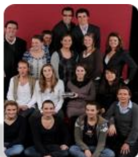
Talent de l'équipe Abbeville hockey sur gazon