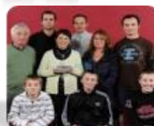
Talent du collégien OMNISPORT : Collège du Ponthieu Abbeville