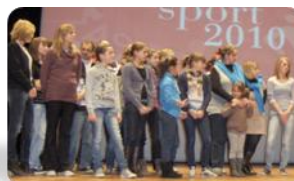
Talent de l'association sportive ESCLAM Gymnastique