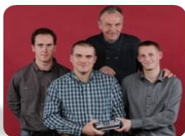
Talent du Sport Picard Equipe de ballon au poing de Louvencourt

11 récompenses ont été remises dans différentes catégories :