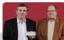
Talent de la manifestation sportive 21ème National de pétanque organisé par ASPTT Amiens Pétanque.