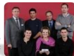
Talent du handicap Comité Département Handisport